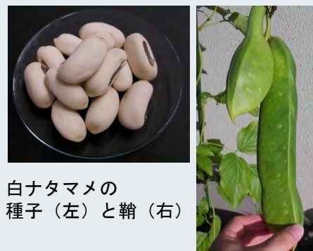
白ナタマメの 種子 (左) と 鞘 (右)

植物性食品の多くは加工食品への利用がほとんどありません。その一因として、加工方法や加工特性を明らかにする研究報告が乏しいことが挙げられます。私はこれまでに、利用の少ない雑豆のナタマメに着目し、食品としての利用促進を目指した基礎的研究に取り組んできました。本講演では、ナタマメの加工方法、加工特性のほか、新たに見出した機能性成分についての知見と今後の可能性について紹介します。