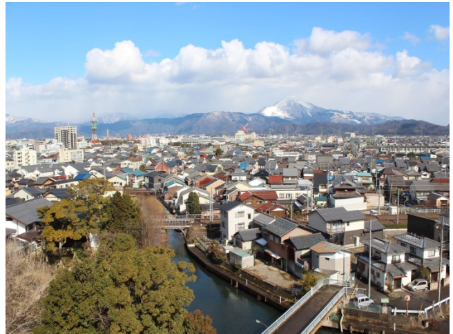
長浜市街地と伊吹山

長浜の黒壁を中心とするまちづくりは、日本のまちづくりの成功例として高く評価されています。この成功により入込客数は大幅に増え、黒壁が誕生した平成元年には10万人ほどであった来街者数は、平成13年に200万人を超えるに至りました。しかし、直近10年間の来街者数は180万～200万人でほぼ横ばいとなっており、踊り場脱却のための方策が求められています。また、2010年の1市6町合併により、県下第一位の陸地面積を誇るようになっており、この点からも新たな観光戦略が必要となっています。